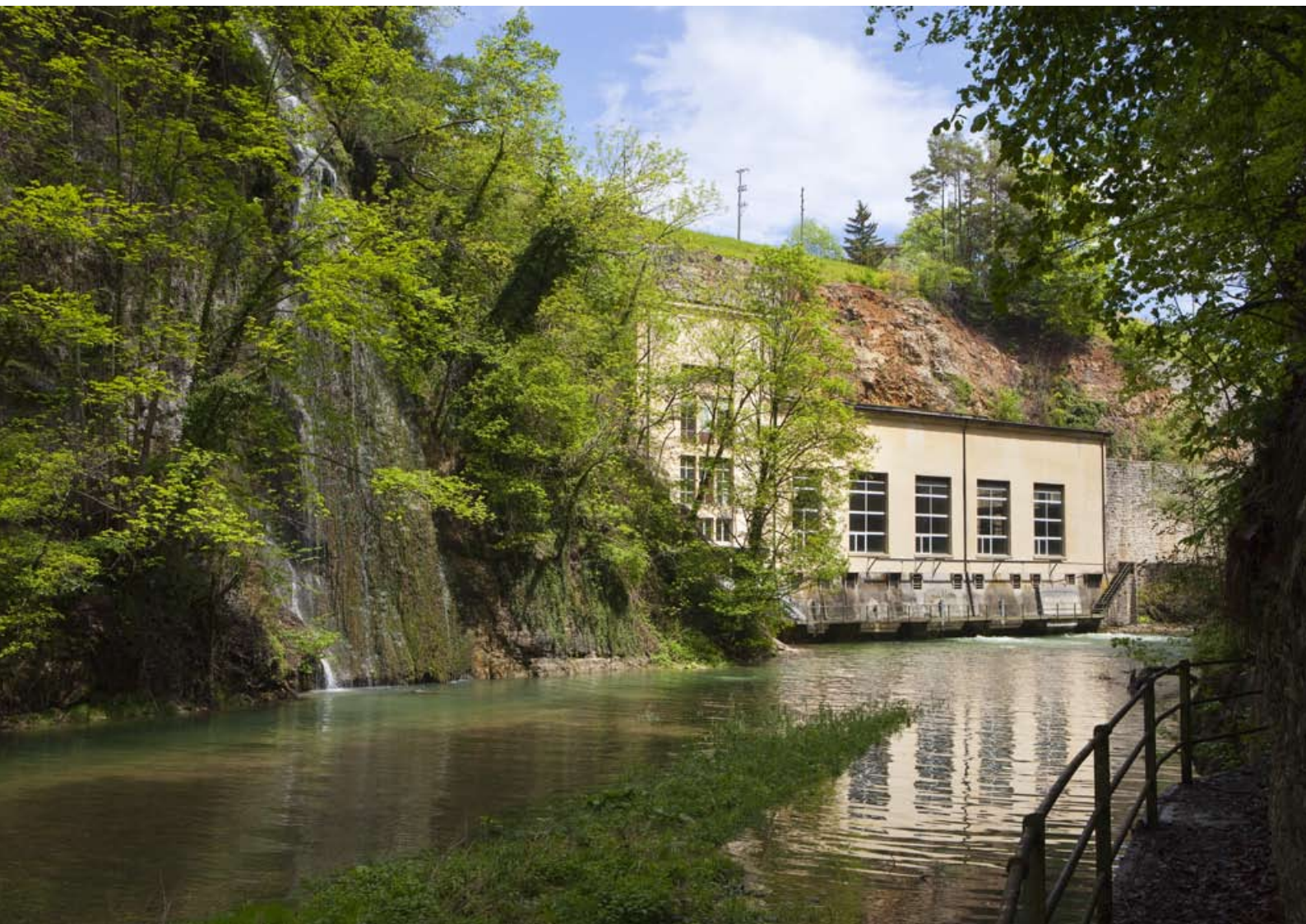
centrale hydroélectrique de Montcherand et laboratoire MhyLab

Des solutions sur mesure pour constructeurs de turbines, producteurs indépendants, bureaux d'études, entreprises électriques, collectivités publiques et organisations non gouvernementales.