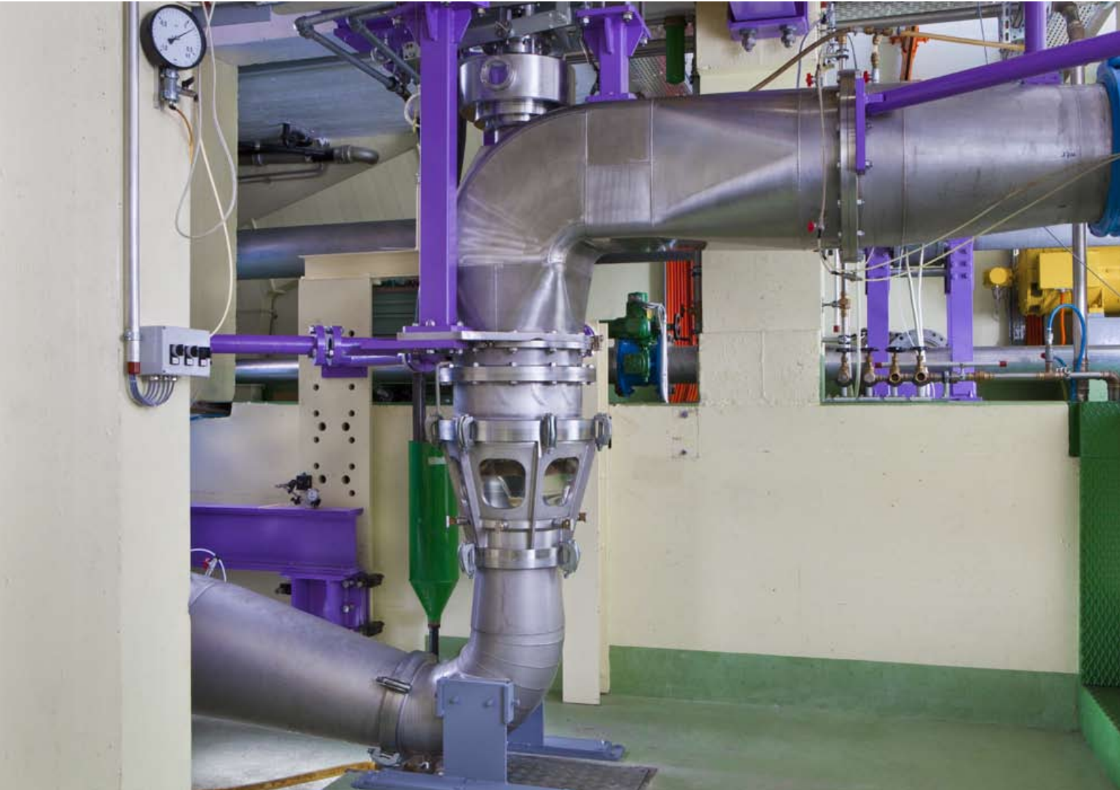
modèle de turbine diagonale sur le stand d'essai MhyLab

Turbines Pelton, turbines diagonales, turbines axiales, turbines axiales très basse chute et pico turbines.