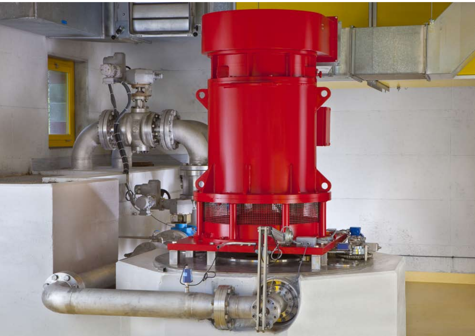
groupe hydroélectrique Pelton (380 kW) turbinant les eaux usées de Verbier (CH)

Etudes de potentiel, analyses préliminaires de sites et études de faisabilité, avant-projets, procédures de consultation d'entreprises, suivi de fabrication et assistance au maître d'ouvrage.